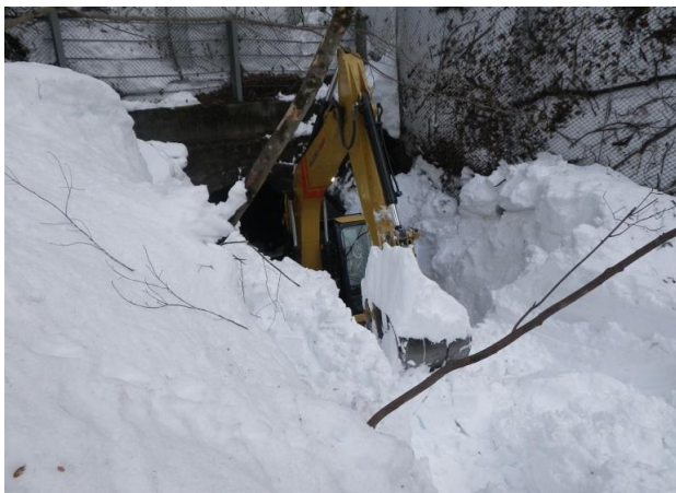
3/3 大黒トンネル通過状況