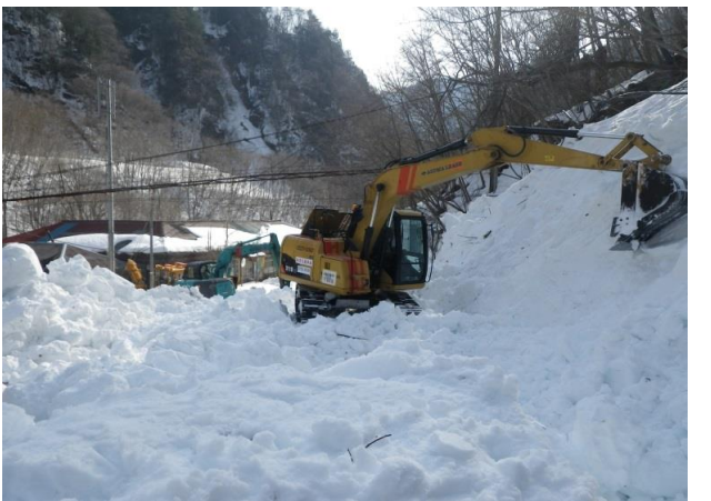
3/4 ニッチツ事務所脇除雪状況