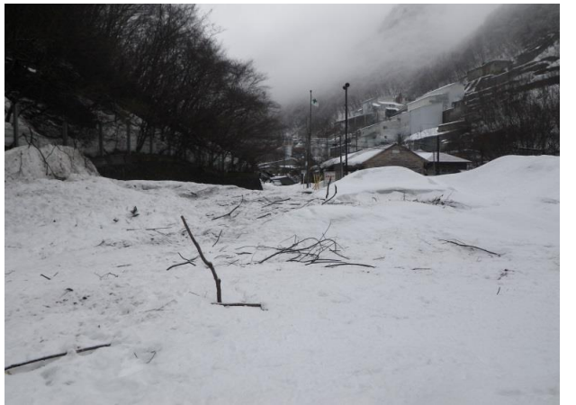
3/2 先遣隊による表層雪崩の痕跡確認