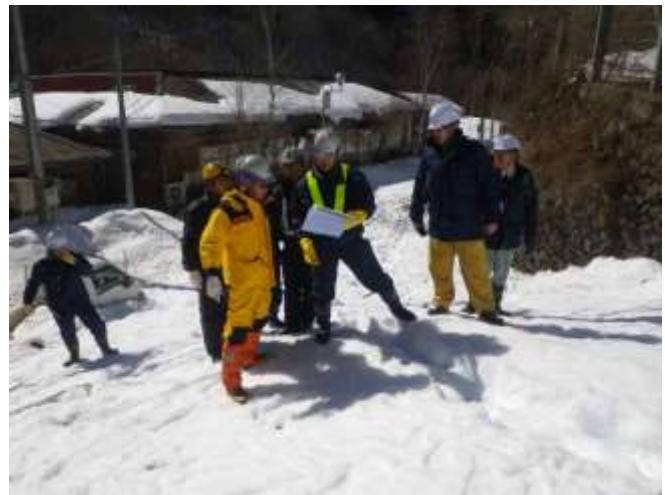
滝上橋～金山橋間現地踏査(3月4日)