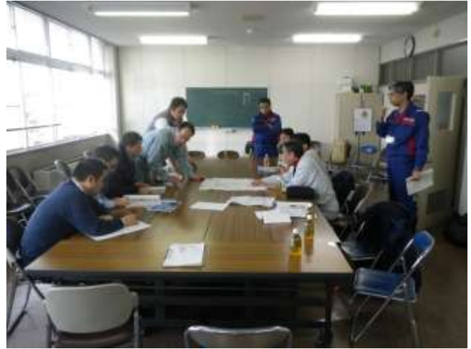
県土事務所報告(2月28日)