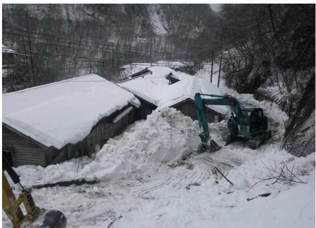
3/5 ニッチツ事務所脇除雪状況