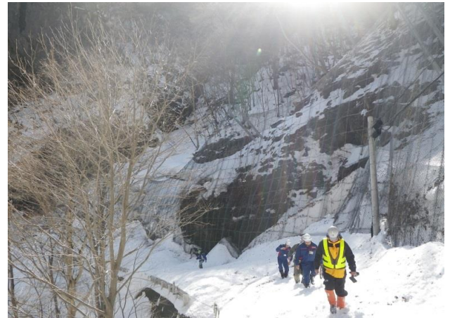
2/28 雪崩危険箇所の踏査確認