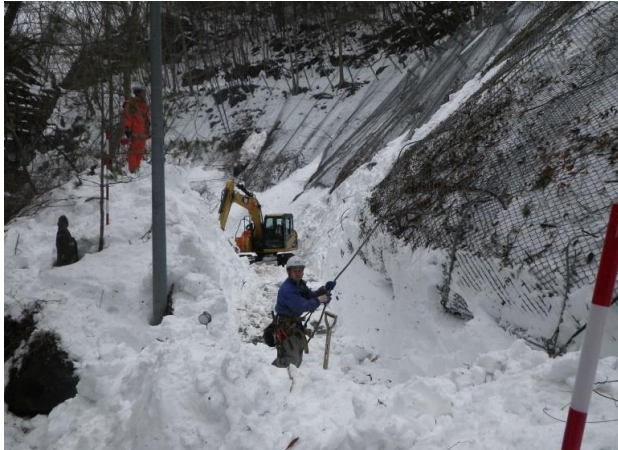
3/1 ネット張替作業時の斜面監視