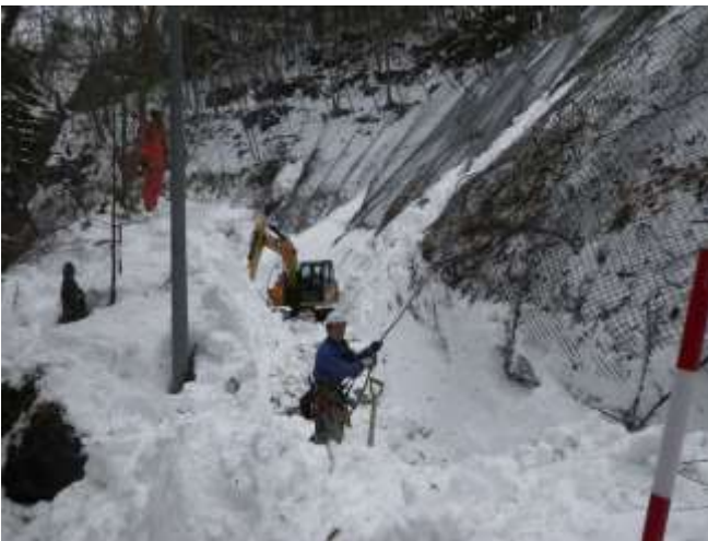
斜面監視状況(3月1日)