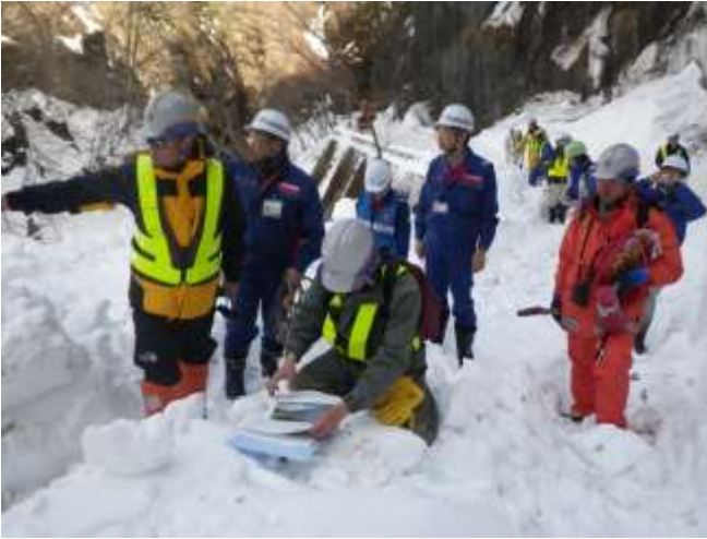
出合トンネル～滝上橋間現地踏査(2月28日)