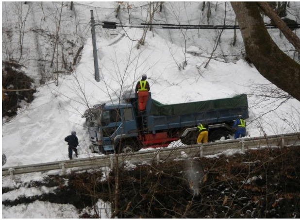
2/27 ダンプトラック撤去状況