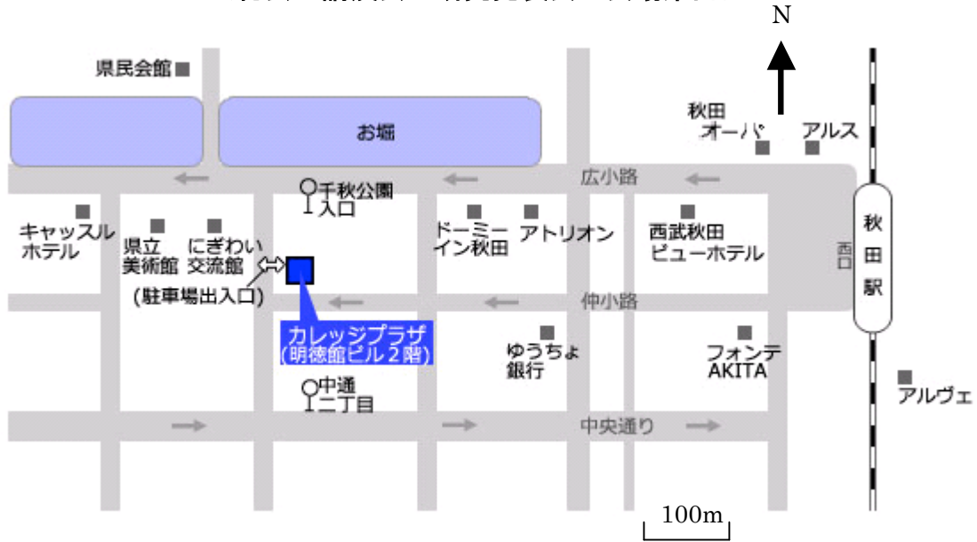
2019 年度東北支部大会会場(秋田カレッジプラザ)周辺図